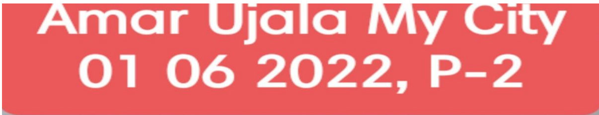
Press release of world no tobacco day

ने पर्यावरण की रक्षा व समाज में तम्बाकू का प्रयोग न हो इसके लिये एनसीसी कैडेट्स के साथ रैली निकाली व मसाज को नशामुक्त भारत के लिये प्रेरित किया।