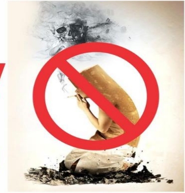
Banner for Rally

Plot No. 8 & 9, Knowledge Park-II, Greater Noida, Delhi-NCR, India