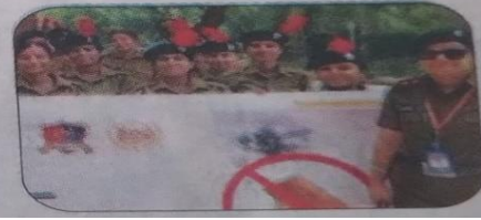
Press release in Amar Ujala